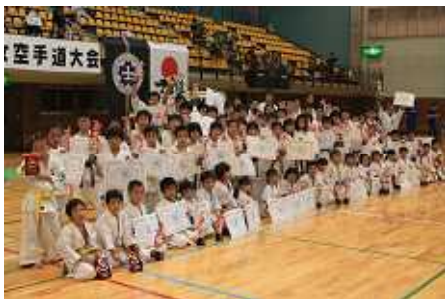
第25回大会入賞者記念撮影